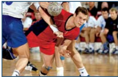
Leukotape K kan genoprette bevægelighed og velbefindende hos mange smertepatienter.

Et yderligere indsatsområde for Leukotape K er lymfødemer i arme og ben, hvor vedvarende massage gennem Leukotape K kan fremme lymfecirkulationen.